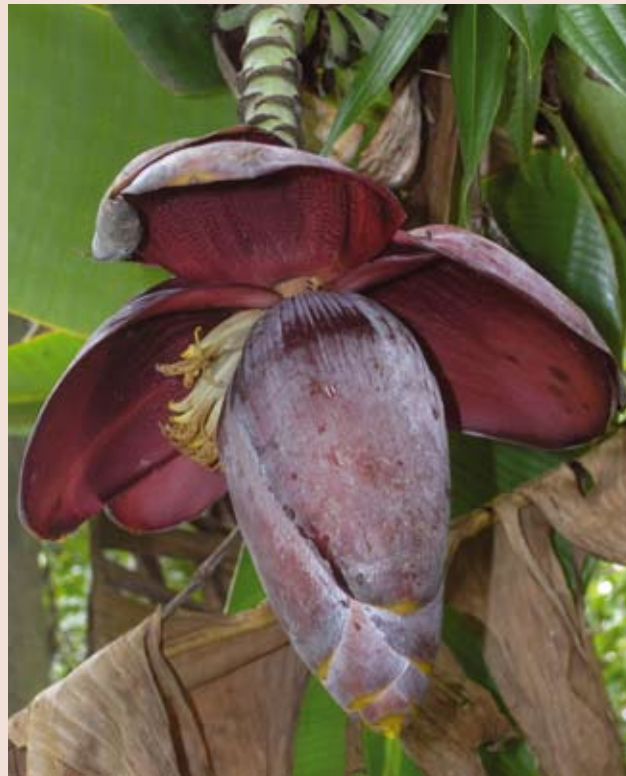
Primer plano de una flor de banano en Sri Lanka. La banana es el cultivo frutal más importante de Sri Lanka.

Los cultivares actuales de banana rara vez producen