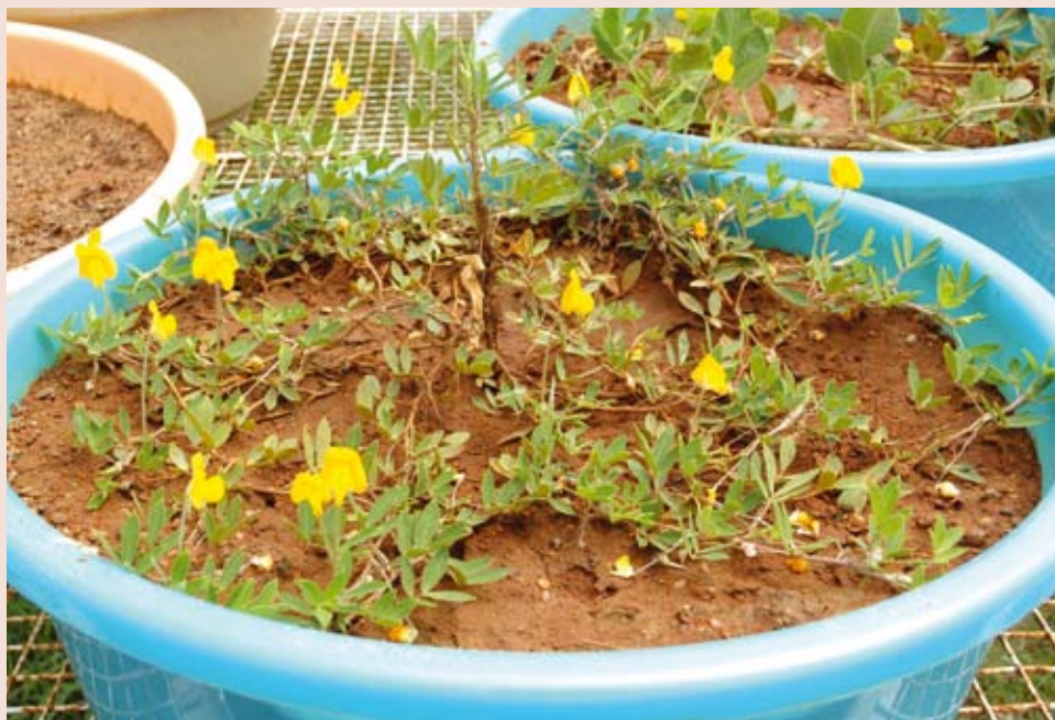
Arachis diogoi , un pariente silvestre del maní.

En todo el mundo unas pocas manchas en las hojas de la planta de maní son suficientes para estrujar de miedo el corazón de los agricultores