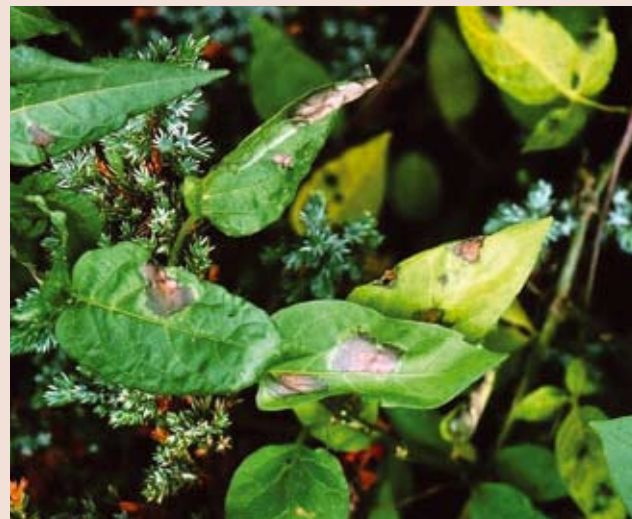
Hojas de una planta de papas infestada con tizón en Irlanda septentrional. Esta enfermedad mortal arrasó los campos de papas de Irlanda en el decenio de 1840.