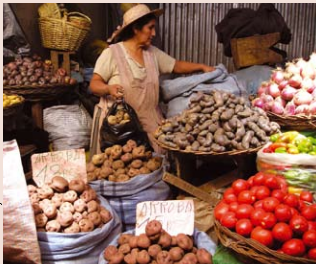
Un puesto de verduras en Cochabamba, Bolivia, despliega un impresionante muestrario de papas distintas. Un reciente estudio del IRRI y Bioversity International estimó que hacia 2055 unas 13 de 107 especies de papas silvestres podrían haberse extinguido.

Por Annie Lane y Andy Jarvis, Bioversity International, y Robert Hijmans, IRRI