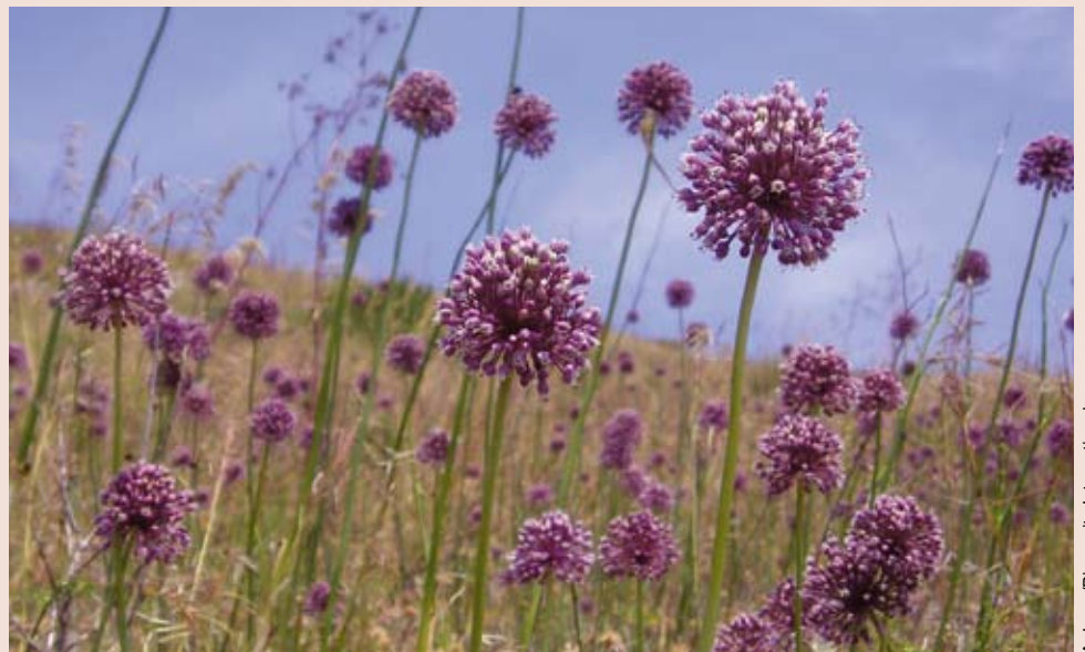
Cebolla silvestre, Italia. Los parientes silvestres de cultivos contienen un inmenso potencial para ayudar a la agricultura a enfrentar los desafíos futuros.

Numerosos parientes silvestres tienen dificultades para cruzarse con el cultivo