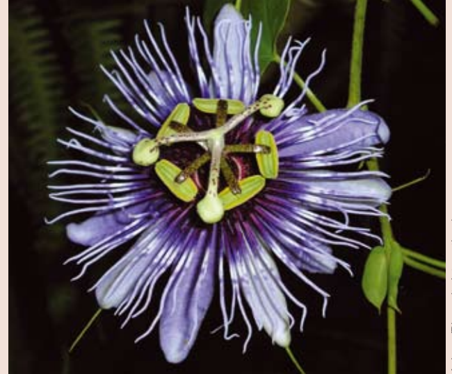
Una granadilla en Bolivia. Los parientes silvestres de los cultivos son una valiosa fuente de variación que podemos utilizar para que los cultivos se adapten a las cambiantes condiciones del medio ambiente y a las necesidades humanas.

Para mayor información dirigirse a Annie Lane, Bioversity International a.lane@cgiar.org