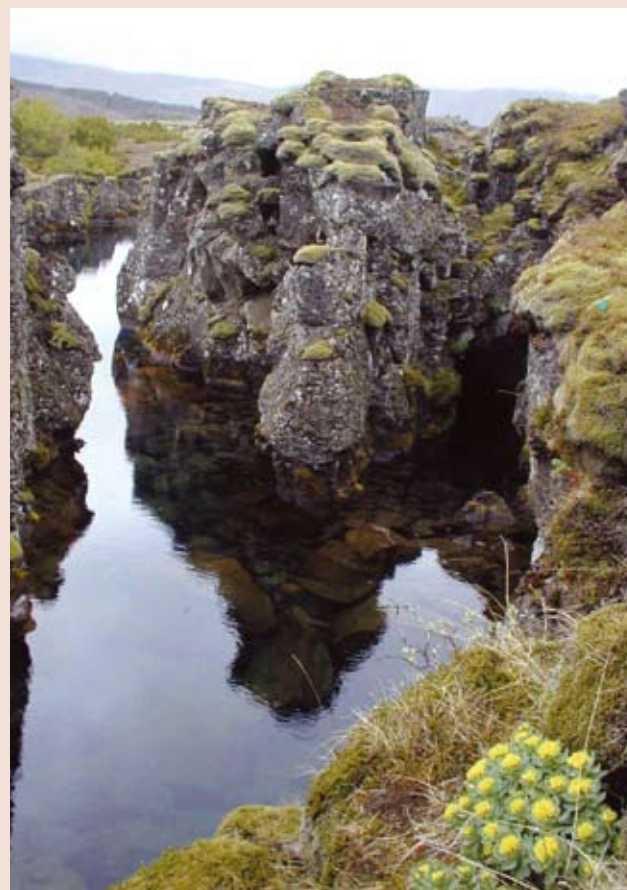
Noruega y Finlandia han iniciado la producción comercial de la planta silvestre roseroot , utilizada para combatir la depresión.

Crear un valor comercial para las plantas es un gran incentivo para preservarlas