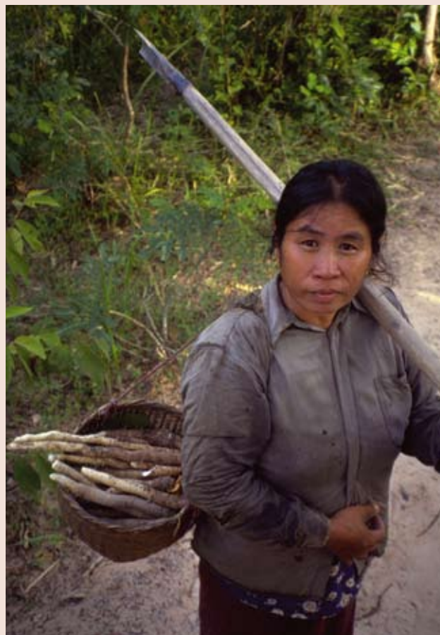
L. Thomson/Bioversity International

Por Kelly Wagner, Bioversity International