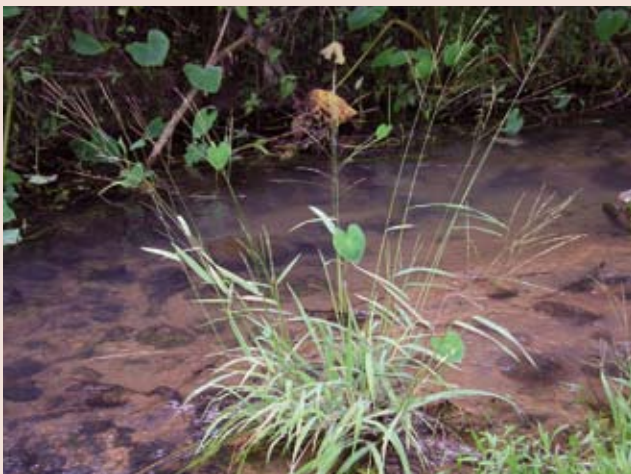
Un pariente silvestre del arroz proporciona resistencia contra el virus del achaparramiento, una enfermedad que en el decenio de 1970 causó pérdidas devastadoras a los agricultores del Asia meridional y oriental. Sri Lanka.

Por Ruth Raymond, Bioversity International