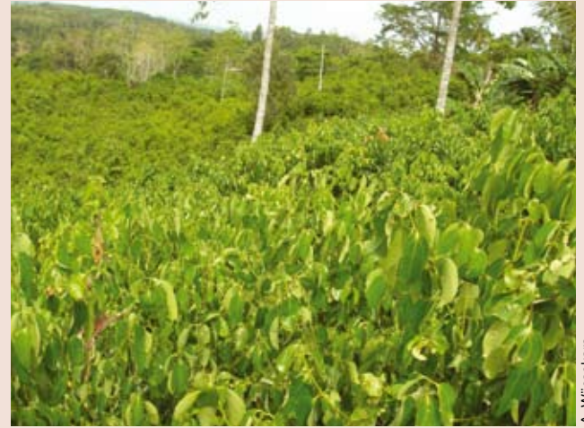
Plantación de canela en Sri Lanka.

La especia se obtiene secando la parte central de la corteza de la planta de