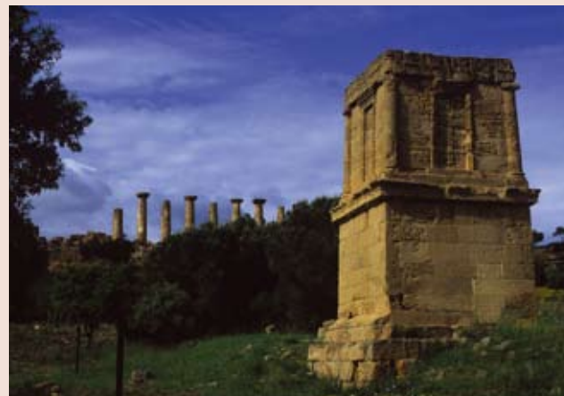
Parco Archeologico e Paesaggistico della Valle dei Templi

Los conservacionistas necesitan directrices para mantener los parientes silvestres en sus hábitat naturales