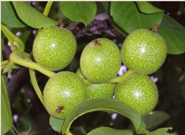
Los nogales son uno de los cultivos objetivo del proyecto sobre Parientes Silvestres de Cultivos del PNUMA/GEF-Bioversity International (antes IPGRI).

Los parientes silvestres de cultivos son herramientas valiosas